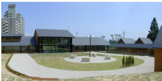
バーベキューコーナー（可動式のコンロ有）