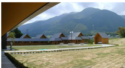
比良山系とログハウス