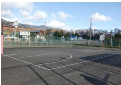
バスケットコート（1面）